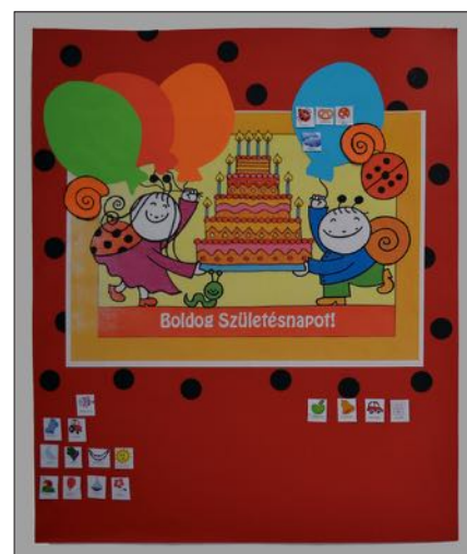
A Születésnapi tábla a 7. szokáshoz

A Nevelési Program célja , amely a 7 szokás megismertetésével és a mindennapi gyakorlati tevékenységünkben is használható ötletekkel, a napi nevelőmunkában folyamatosan és fokozatosan beépítve gazdagítja a nevelőket és ez által, a reá bízott gyermekeket személyiségük kibontakoztatásában és fejlesztésében.