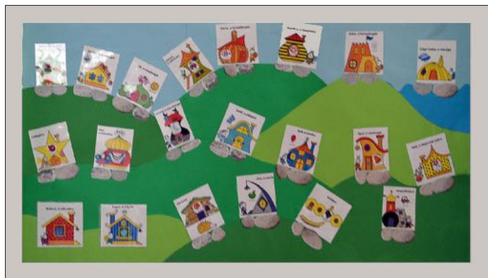
A pozitív megerősítést és a gyermekek jó erényeinek alapozását, gyakorlását szolgálja ez a tábla

Az első alkalommal sok olyan fogalmat elevenítettünk fel, amelyeket eddig is ismertünk, de jó volt újratanulni, felidézni emlékezetünkben, de voltak számunkra ismeretlen fogalmak is, amelyek a rácsodálkozás élményével hatottak ránk, a 7 szokással való ismerkedés, hogy milyen egyszerű fogalmak és mégis milyen nehezek. Egyszerűek, mert a mindennapjainkban is próbálunk felelősségteljes életet élni, tervezni, a teendőinket is rangsorolni, de így együtt látni, hallani, hogy a függésből hogyan is lehet függetlenedni, vagy a szokásként emlegetett „gondolkodj nyer-nyerben” a kreatív együtt dolgozás, a gyermekekkel, munkatársakkal való együttműködés hangsúlyos megvalósítása nagyon nagy hatást gyakorolt ránk, óvónőkre.