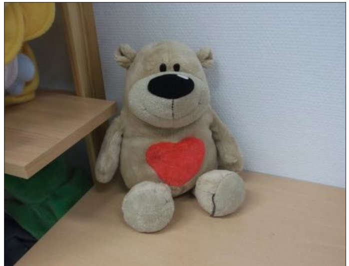
A „Csupa - szív Maci” amely a gyermekek feszültségét oldja, feltölti szeretettel és segít a jó tulajdonságaik megerősítésében. Állj meg egy pillanatra és gondolkodj döntésed előtt!

Sokszínű, érdekes volt az egész továbbképzés. Az elméleti rész is tele volt érdekes és figyelemfelkeltő rövid filmekkel, amit közösen megbeszéltünk a vetítés után. A gyakorlati ötletek, és a közös játékok voltak azok, melyeket a mindennapi életben, a munkánk során a gyakorlatban használhatunk, ötleteket meríthetünk belőlük.